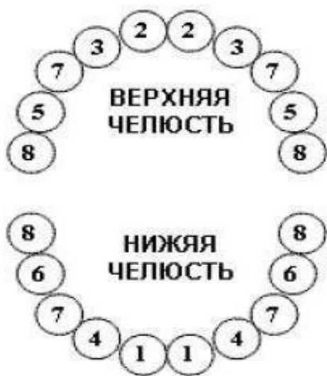
Схема расположения зубов (номера показывают порядок появления)